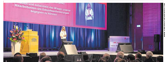
Am 16. März 2022 findet zum 27. Mal das qualityaustria Forum statt

S elbstverantwortung und Selbstbestimmung im Arbeitsumfeld, vielfältige Gestaltungsmöglichkeiten hinsichtlich Umwelt- und Arbeitsschutz sowie die damit verbundene neue Definition des „Ichs“ werden für Arbeitnehmer*innen zunehmend attraktiver. Dies zeigen auch Megatrends wie Individualisierung, Sinnfokus (Purpose), Kreislaufwirtschaft und Sicherheit. Gesellschaftliche Erwartungshaltungen, Bedürfnisse am (Arbeits-) Markt sowie Anforderungen an Produkte sind dynamisch und befinden sich stetig im Wandel. Dadurch muss auch der Begriff „Qualität“ laufend neu definiert und um aktuelle Aspekte erweitert werden. So