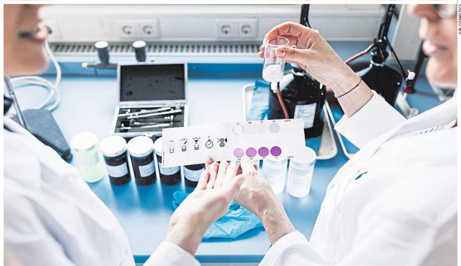
Ein wichtiger Teil bei GW Cosmetics ist der Bereich Forschung & Innovation, um neue Produkte zu entwickeln

„Die Jahre 2020 und 2021 waren bis jetzt die erfolgreichsten unseres Unternehmens. Was wir im Profisegment durch die behördliche Schließung von körpernahen Dienstleistern wie Friseure und Kosmetiksalons verloren haben, konnten wir im B2C-Bereich sowohl mit unserer DIY-Marke BeautyLash als auch im Private Label-Bereich mit Augenbrauen- und Wimpernfarbe mehr als nur wett-